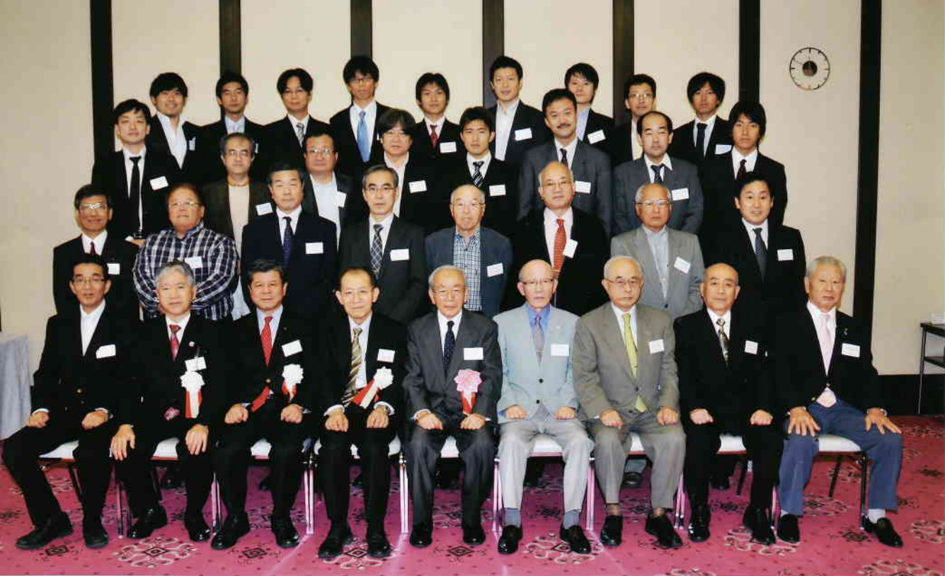
久留米大学附設高等学校同窓会中国四国支部總會 平成23年11月13日 於 鯉城会館「パールの間」